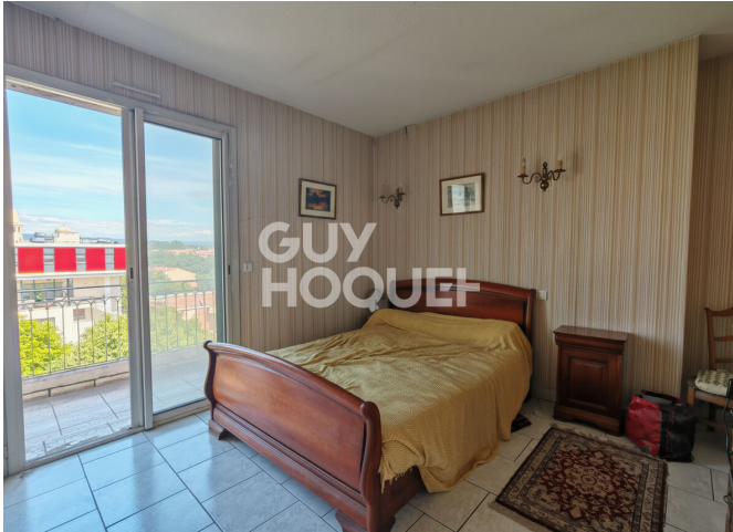
Photo du bien