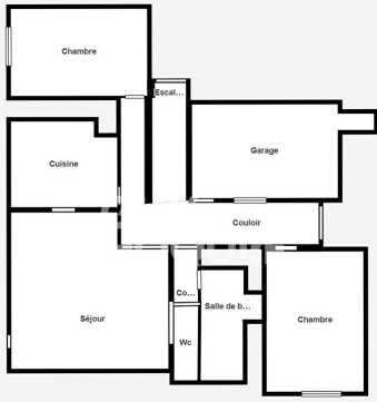
Matterport Property Report Appartement de charme avec jardin et garage - 125 m 2 - Proche centre de Carpentras. Floor 1 Size and dimensions are approximate, actual may vary.