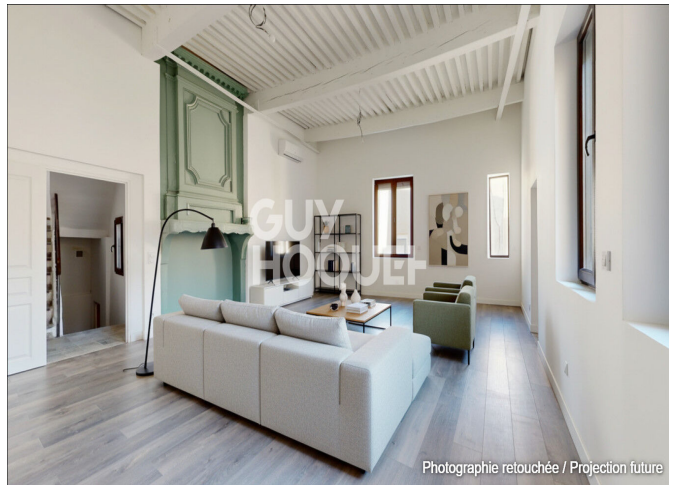
Photographie retouchée / Projection future