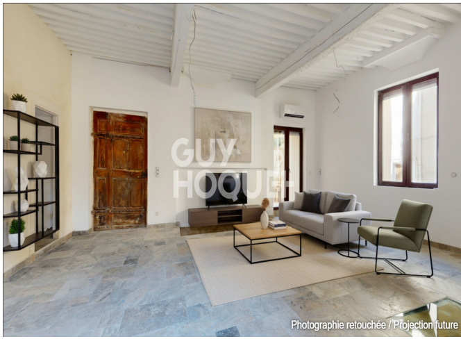
Photographie retouchée / Projection future